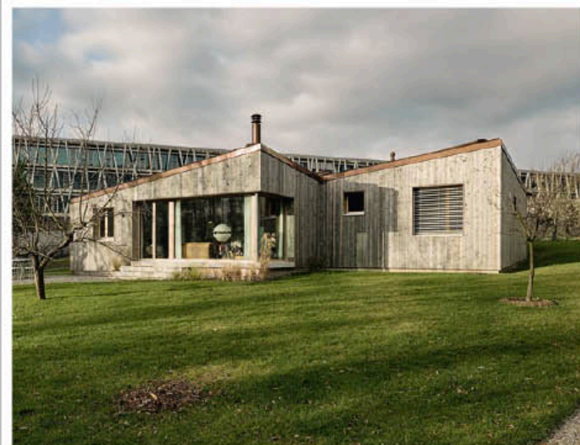
La maison épouse le relief du terrain et s'intègre ainsi harmonieusement à son environnement.

Les pentes différentes sont projetées pour que les vues depuis l'extérieur soient diverses selon les orientations. La variation de hauteur engendrée par les pans inclinés profite à la fois à la qualité des espaces intérieurs et met en valeur les