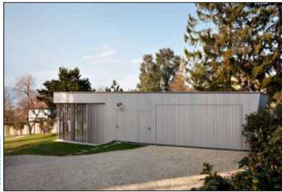
Une bâtisse à l'articulation ingénieuse. «On a déporté la structure pour que la façade regarde le lac. Cet accident dans le bâtiment est intimement induit par la forme du terrain», explique Yasmin Nicoucar.